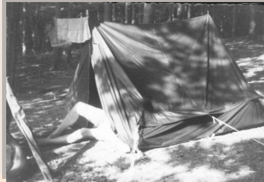
Zelten in Mecklenburg Vorpommern