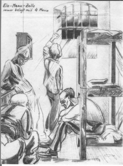
Zelle in Bautzen 1954

Gedicht eines Unbekannten unter unmenschlichen Bedingungen 1950 in Bautzen, nach Verteilung von Holzschuhen, getextet