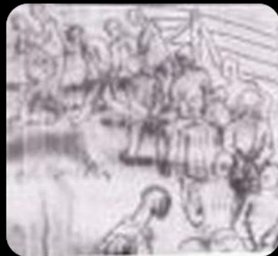
Hofgang 1954 Bautzen „gelbes Elend“

Der Holzschuhtanz in gestreifter Kluft, die Flüche wildgeword'ner Wächter, Tausende von Toten in einsamer Gruft – hält uns wie Teufels Hohngelächter !